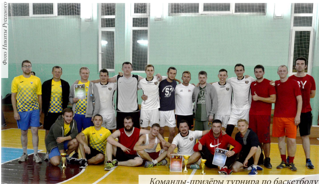
Команды-призёры турнира по баскетболу

имущества перед заключительной четвертью выглядели весьма внушительно. Но на решающую часть «электриков», сделавших ставку на мощь и габариты своих лидеров, не хватило. «Лёгкий» состав РЦ не без труда, но всё же разложил на лопатки измотанного соперника, вконец потерявшего ориентацию во времени и пространстве. От усталости непослушные руки оппонентов с непривычной регулярностью били мимо кольца, а закрывать «метких живчиков» на трёхочковом периметре элементарно не успевали ноги. А визави, в свою очередь, исправно били в цель с любых позиций, а на подборках под кольцом уверенно хозяй-