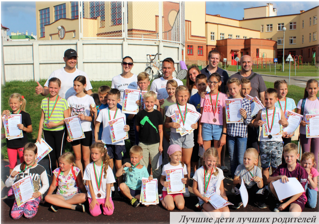
Лучшие дети лучших родителей