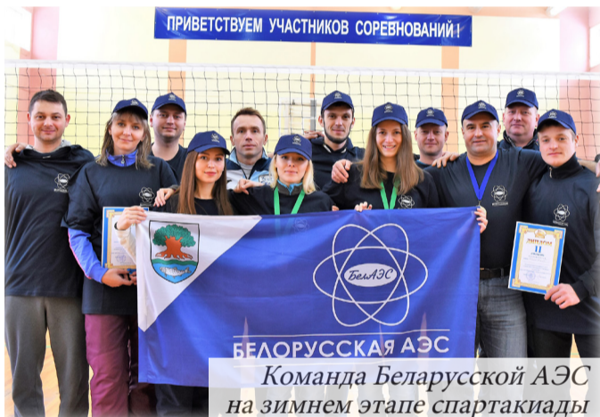
Команда Беларускай АЭС на зимнем этапе спартакиады

Всем давно известно, что состав команды Бе-