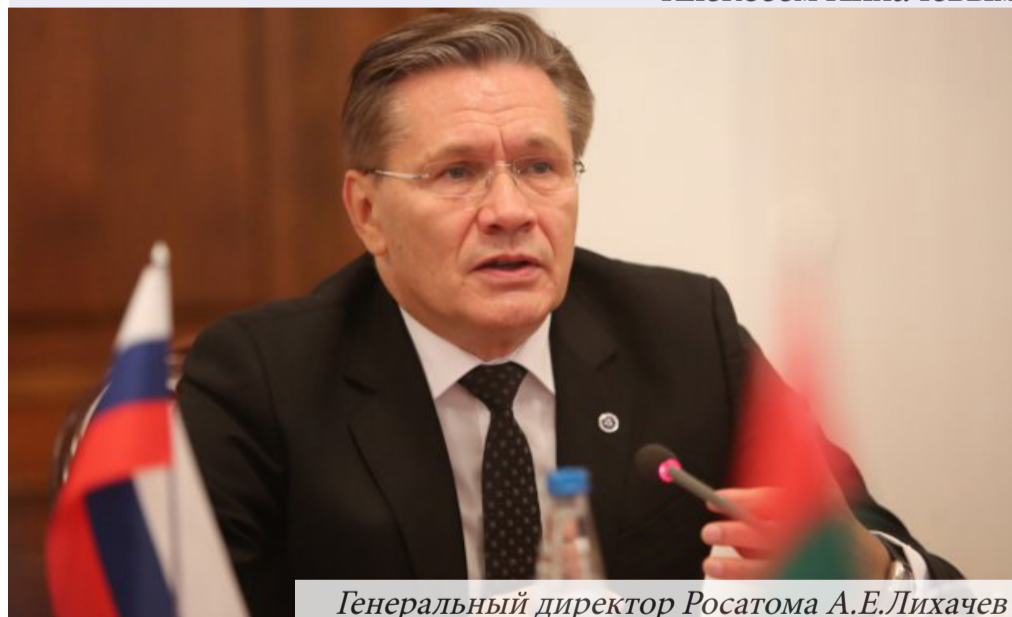
Генеральный директор Росатома А.Е.Лихачев

Госкорпорация «Росатом» подтверждает планы по вводу в эксплуатацию первого блока БелАЭС до конца 2019 года. Об этом шла речь на встрече премьер-министра Беларуси Сергея Румаса с генеральным директором Росатома Алексеем Лихачевым