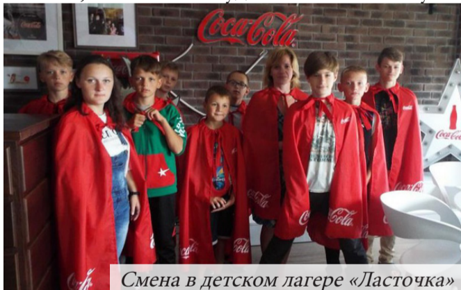
Смена в детском лагере «Ласточка»

государственного предприятия «Белорусская АЭС» направил на оздоровление 55 детей работников станции. Наши дети отдыхали в оздоровительных лагерях «Ласточка», «Su Lietuva», «Восьмое чудо света» и «Наука».