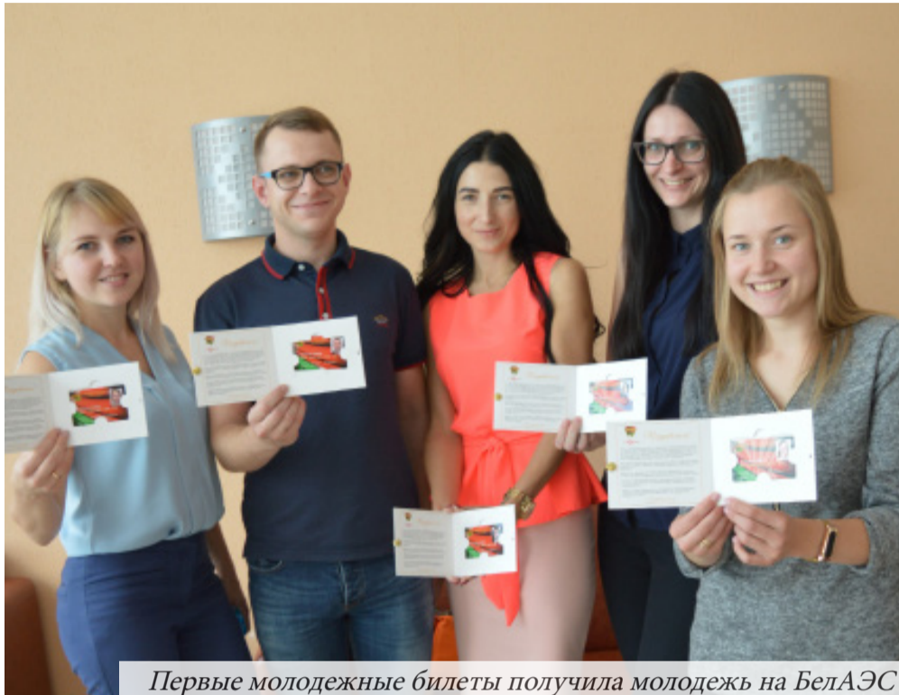
Первые молодежные билеты получила молодежь на БелаЭС

Все держатели членских билетов установленного образца могут стать участниками программы лояльности организаций-партнеров AUTONELP и БРСМ. Чтобы поменять старый билет на новую карточку необходимо обратиться в комитет ПО ОО БРСМ Белорусской АЭС.