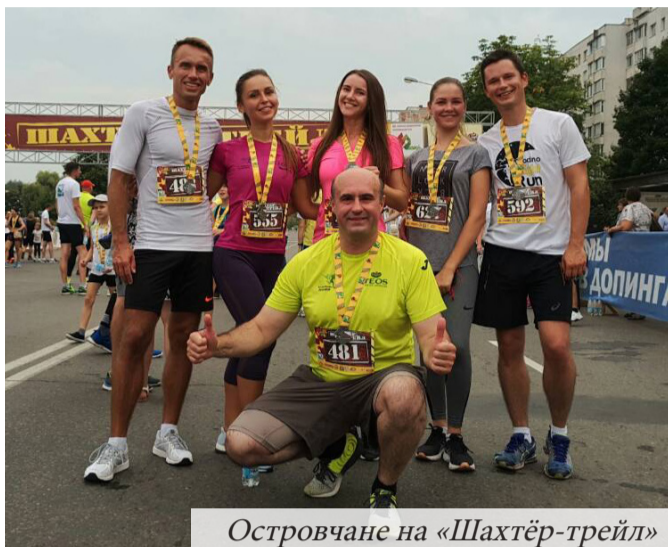
Островчане на «Шахтёр-трейл»

Юбилей города Солигорска, а вместе с ним и крупного градообразующего предприятия «Беларуськалий» совпал с юбилеем нашего Островца. Городу шахтёров «стукнуло» шестьдесят. В последний летний выходной там состоялся массовый забег «Шахтёр-трейл», собравший около тысячи участников